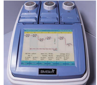
8インチTFTカラー タッチスクリーンディスプレイ