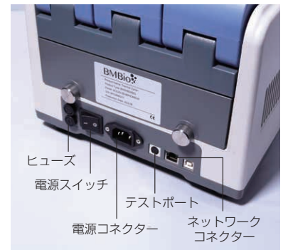
ヒューズ 電源スイッチ 電源コネクター テストポート ネットワーク コネクター