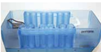
抗体・洗浄液タンク