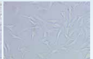
Synovial Mesenchymal Stem Cell