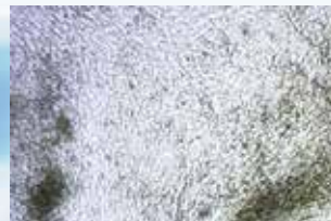
Cardiac Muscle Cell