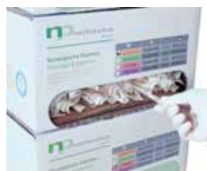
箱の前面に取り出し口があるので、積み重ねて収納できます。