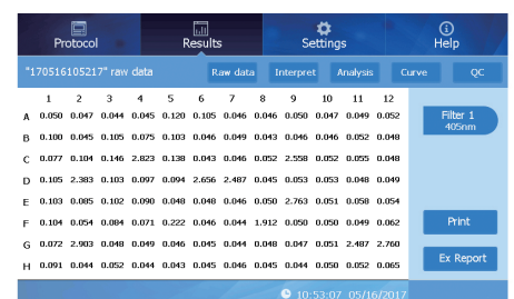
Reading Results Screen