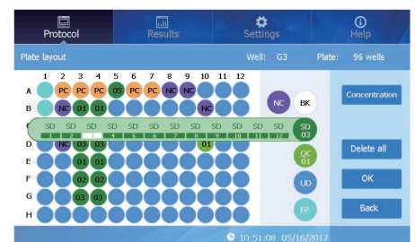
Plate Layout Screen

MR9600-Tは、処理中のプレートをインキュベートするための精密な温度制御が可能なモデルです。環境温度より5℃高い温度から50℃まで維持することができます。